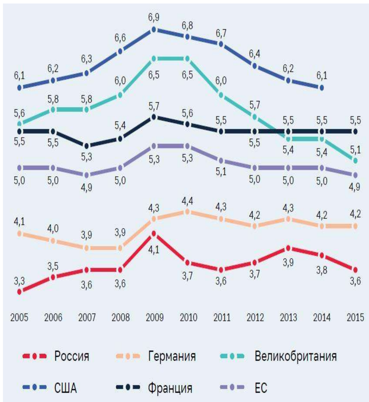
Рис.4 Расходы на образование в разных странах в % ВВП (данные СП РФ)