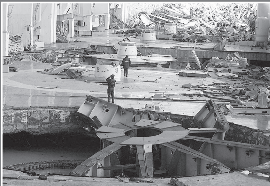
Саяно-Шушенская ГЭС: что было, что стало...