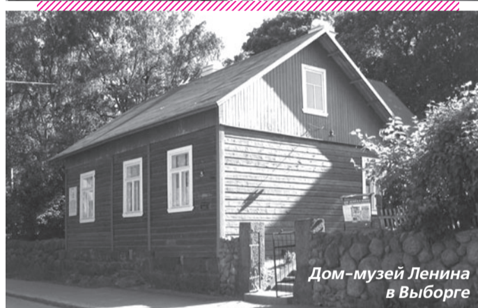
Дом-музей Ленина в Выборге

Фото с сайта rus-tourist.ru использовано в качестве иллюстрации