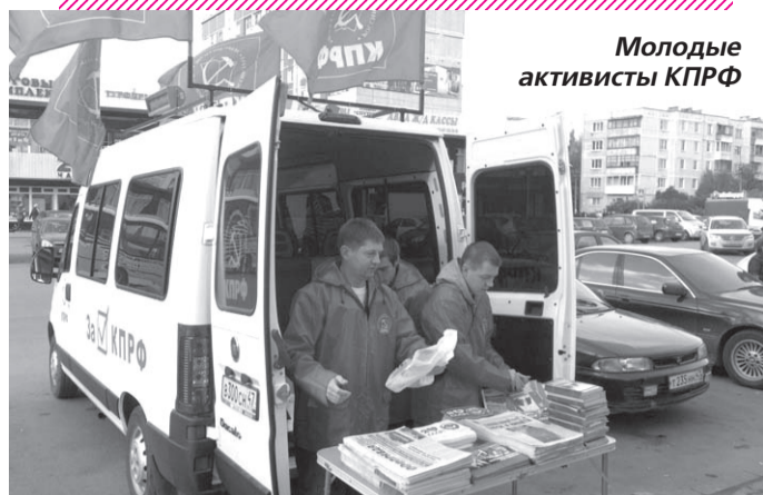
Молодые активисты КПРФ

Колонна празднично украшенных машин с логотипом газеты «Правда» и эмблемой КПРФ будет следовать от одного населенного пункта к другому. Жителям области будут раздаваться специально подготовленные в Ленинградском обкоме КПРФ газеты, листовки и другие агитационные материалы. В конечном пункте автопробега планируется провести торжественный митинг. Будут и другие мероприятия. В районных и городских парторганизациях к этому событию начали готовиться загодя. Участников автопробега будут встречать во многих крупных населенных пунктах. Юбилей всероссийской партийной газеты предполагается отметить интересно, творчески и с большим подъемом. Люди ждут этого праздника.