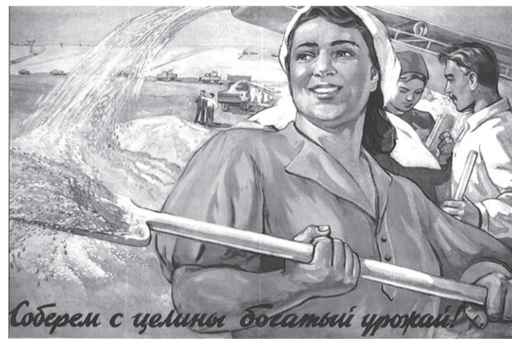
Так было в советское время.

Разрушение сельского хозяйства значительно снизило жизненный уровень населения страны. Более 10% россиян голодают, ещё 20% – недоедают. Острый белковый дефицит и недостаток животных белков испытывают 60% населения, которые не могут позволить себе полноценное питание. Уровень покупательной способности снизился более чем вдвое. Во столько же раз снизилась заработная плата. Отсюда переизбыток продовольствия в торговых сетях. Спрос есть, нет денег. Потребление основных продуктов питания в сельских и городских домохозяйствах не соответствует медицинским нормам. Если на селе потреб-