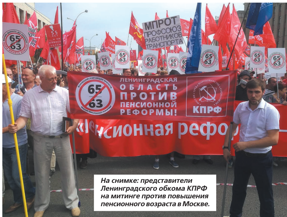
На снимке: представители Ленинградского обкома КПРФ на митинге против повышения пенсионного возраста в Москве.