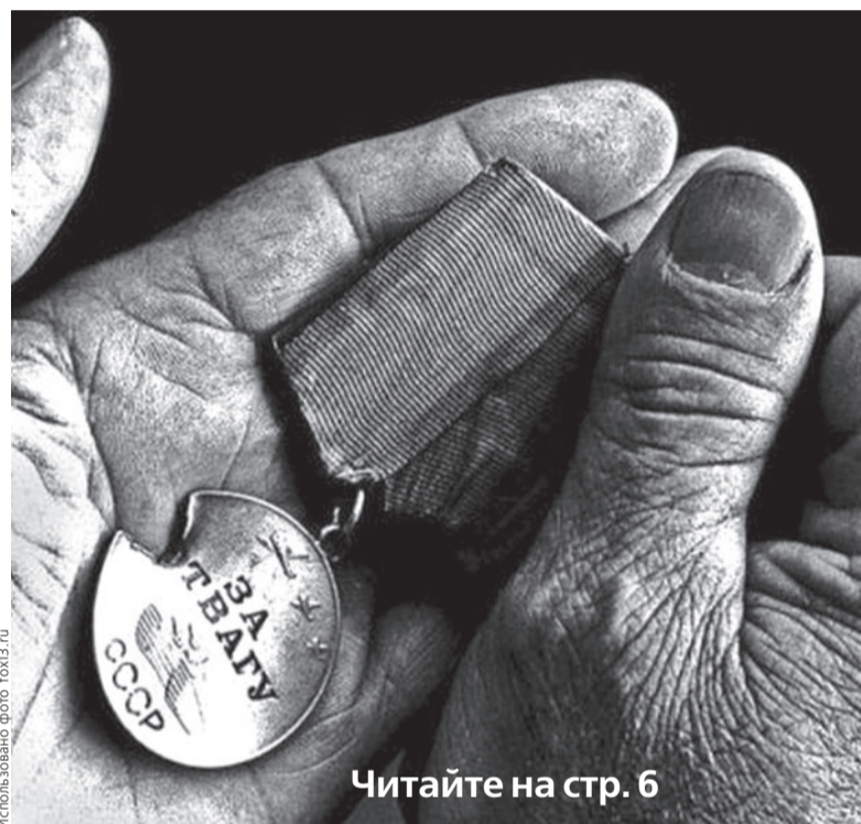
Читайте на стр. 6

В ночь с 21 на 22 июня комсомольцы Ленобласти примут участие в традиционной «Вахте памяти». Это мероприятие, которое организуют Санкт-Петербургский городской и Ленинградский областной комитеты КПРФ, в последние годы стало важным символом Дня памяти и скорби, каким, без сомнения, является день начала Великой Отечественной войны.