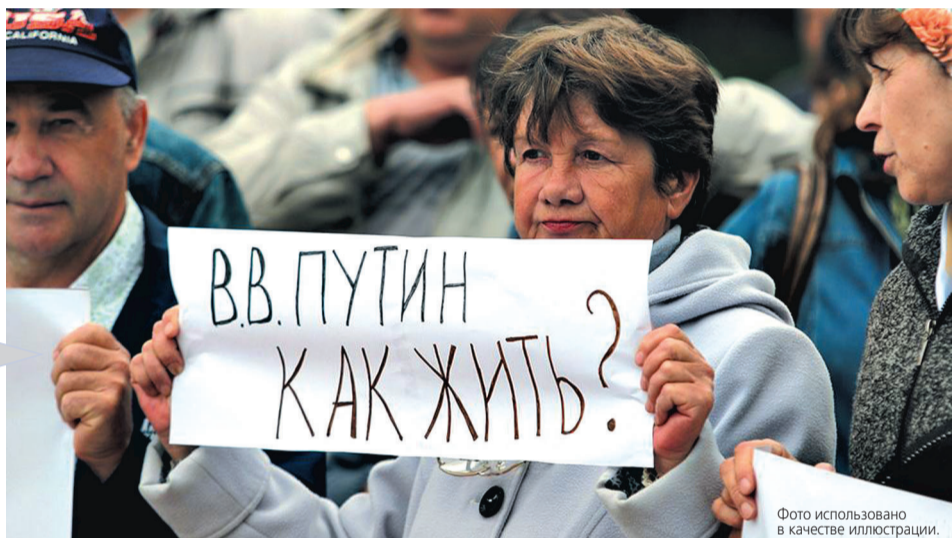
Фото использовано в качестве иллюстрации.

Как и положено, в последние годы социально-экономическое развитие России задаётся указами президента РФ. В мае вышел только первый указ, который ставит задачи перед правительством РФ в части увеличения, удвоения или вхождения России в десятку, пятёрку или ещё куда-то, но в «прорыв»! Документ называется «О национальных целях и стратегических задачах развития Российской Федерации на период до 2024 года».